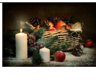
А) Новый год